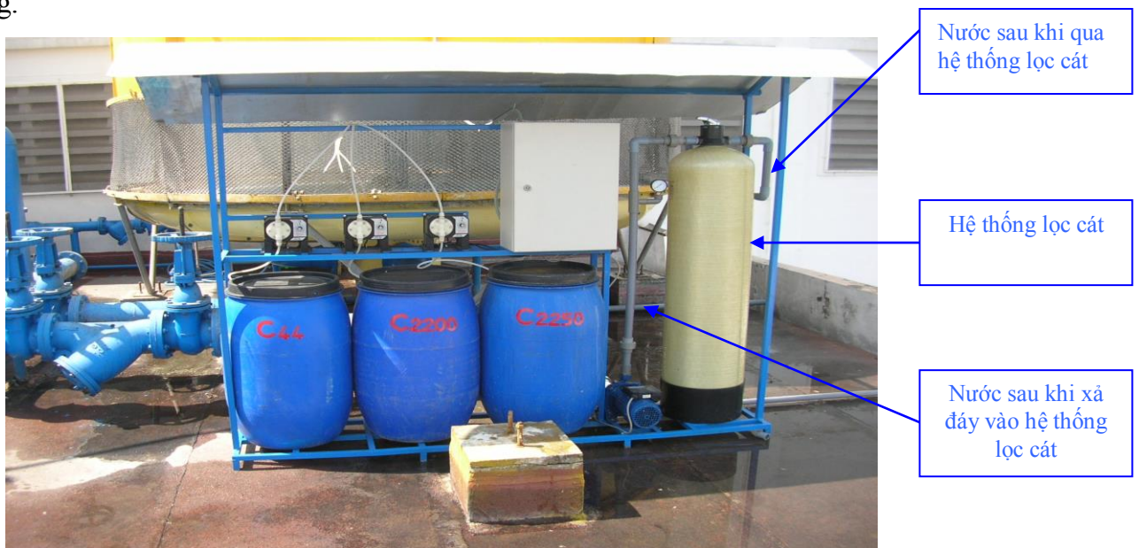
Hình 2: Hình ảnh minh họa hệ thống lọc cát của Long Trường Vũ

Long Trường Vũ sẽ trực tiếp hướng dẫn người vận hành quá trình rửa ngược hệ thống.