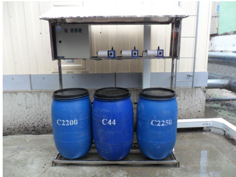
Hình 1– Hệ thống châm hóa chất cho cooling.